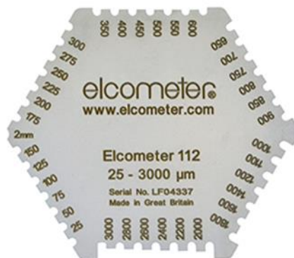
نمونه یک ضخامت سنج فیلم تر

برای انجام این تست از تیغه های مخصوص اندازه گیری فیلم تر استفاده می شود این تیغه ها در بازه های ضخامتی مختلف ساخته شده اند. هریک از این تیغه ها دارای دندانهای مختلف می باشند که نسبت به یکدیگر دارای ارتفاع متفاوت می باشند و در بین دو پایه اصلی در امتداد یکدیگر قرار گرفته اند. شکل زیر نمونه یک ضخامت سنج فیلم تر (Wet Gauge) را نمایش می دهد.