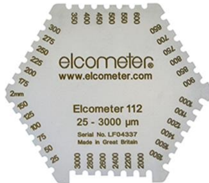
نمونه یک ضخامت سنج فیلم تر

برای انجام این تست از تیغه های مخصوص اندازه گیری فیلم تر استفاده می شود این تیغه ها در بازه های ضخامتی مختلف ساخته شده اند. هریک از این تیغه ها دارای دندانهای مختلف می باشند که نسبت به یکدیگر دارای ارتفاع متفاوت می باشند و در بین دو پایه اصلی در امتداد یکدیگر قرار گرفته اند. شکل زیر نمونه یک ضخامت سنج فیلم تر (Wet Gauge) را نمایش می دهد.